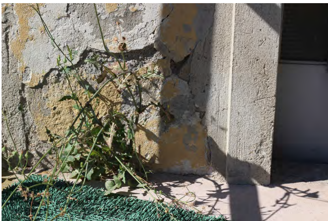
47z- Corpo principale