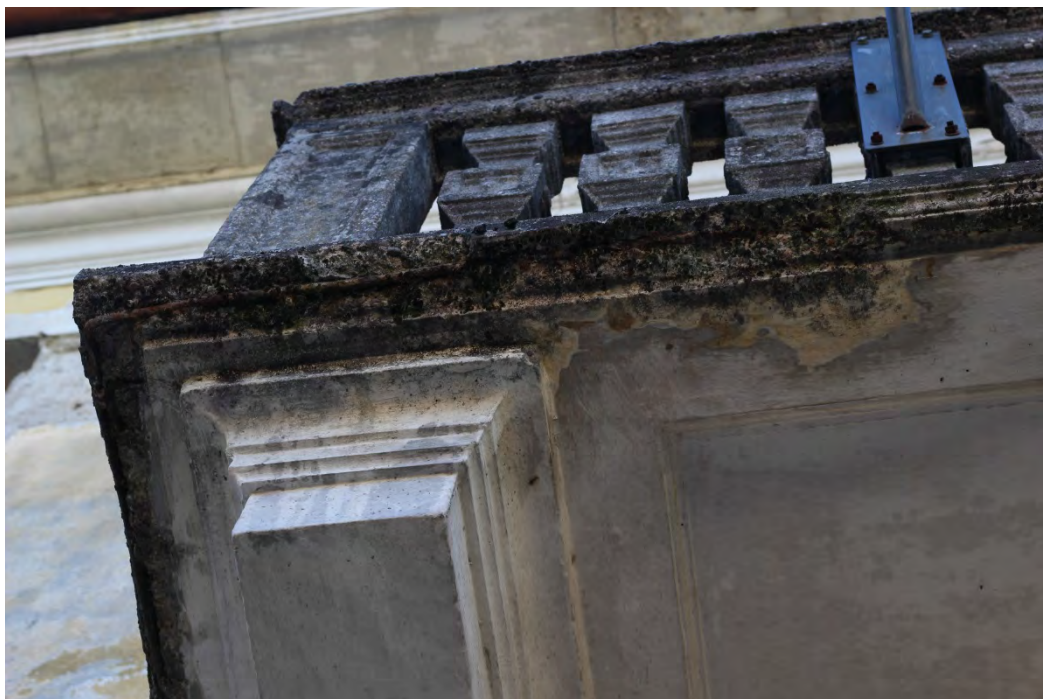
63b- Balcone – particolare del bordo inferiore

Il rivestimento esterno – davanzali e balcone