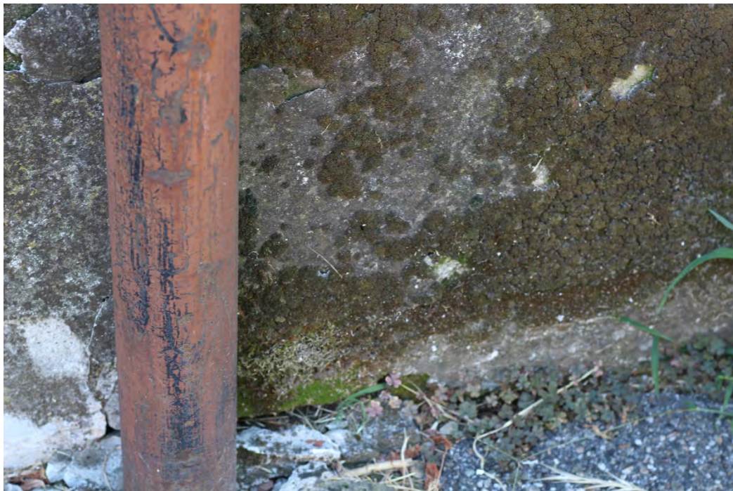
36z- Corpo principale