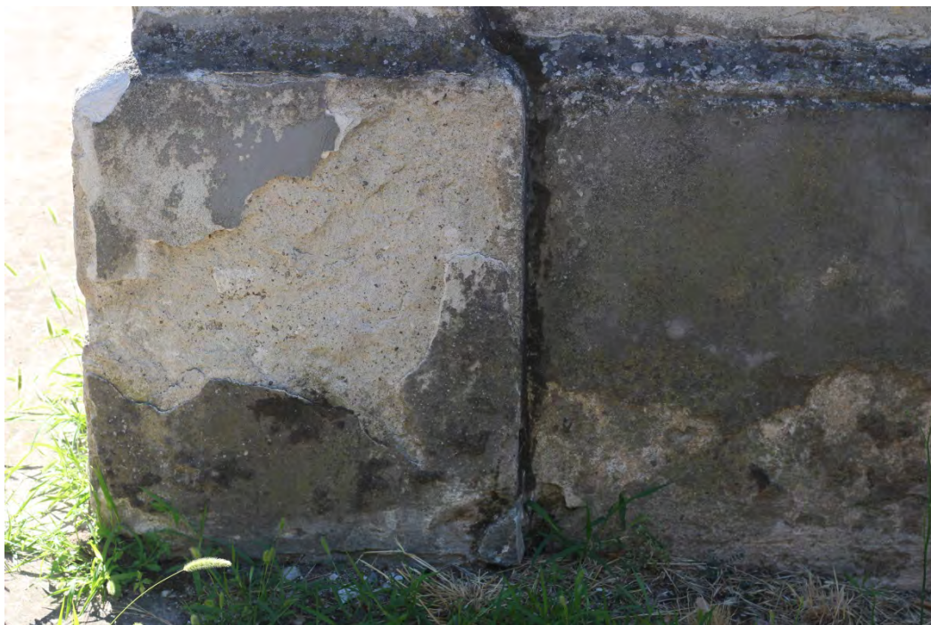
28z- Corpo principale

Il rivestimento esterno – le zoccolature*