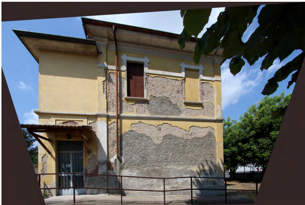
23- Facciata nord