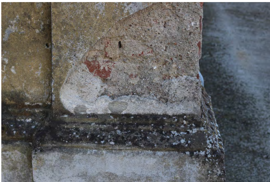
37z- Corpo principale