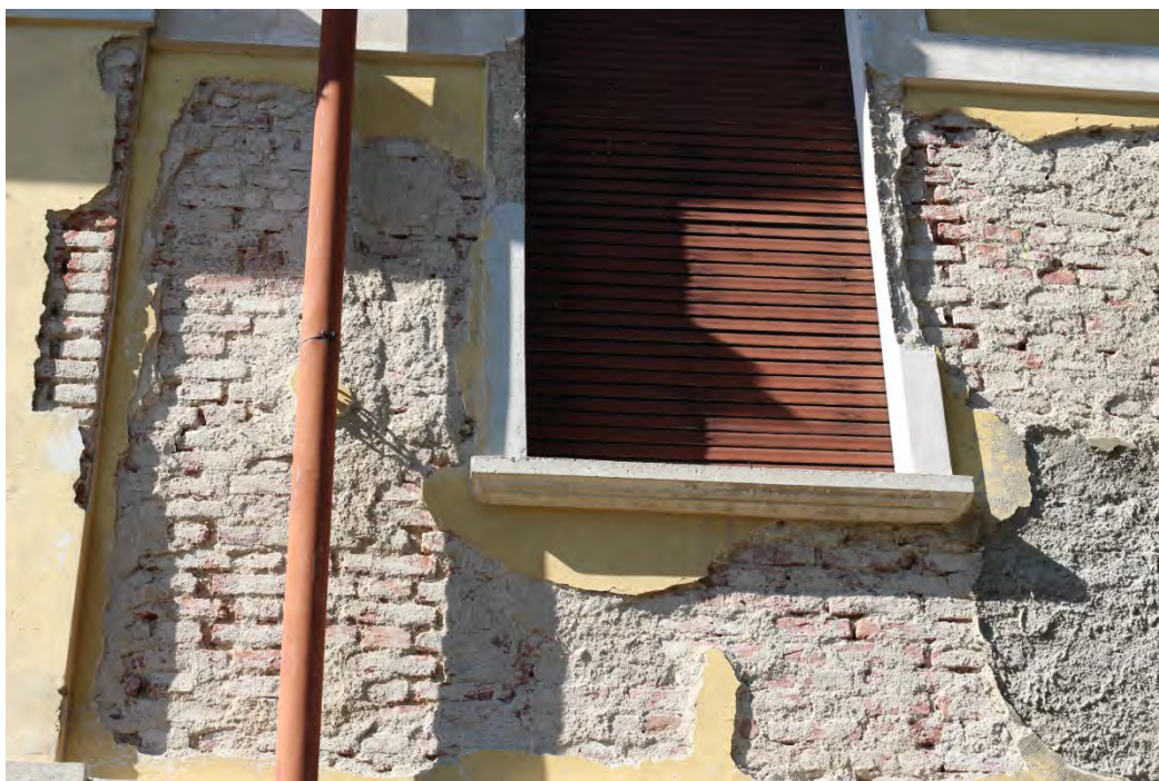
86i- Corpo principale – muratura senza intonaco e parziale ripresa con malta cementizia