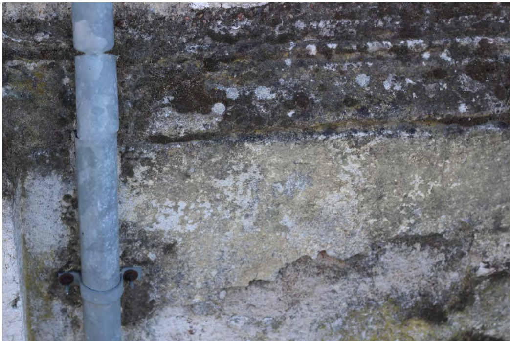
38z- Corpo principale