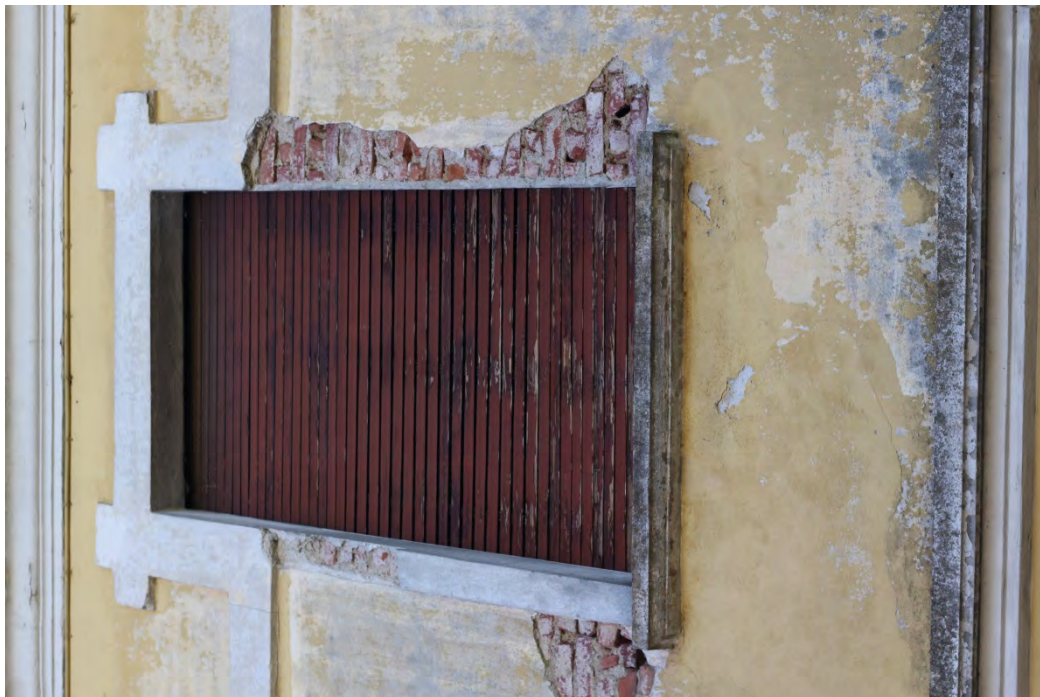
71i- Corpo principale –presenza di umidità sopra la fascia marcapiano