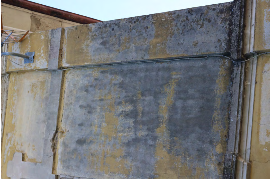
73i- Corpo principale –presenza di umidità sopra la fascia marcapiano e sulla lesena del pilastro