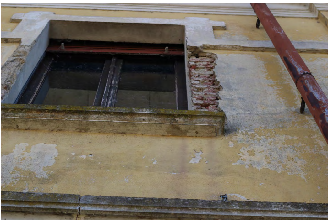
54c- Corpo principale – cornici finestre