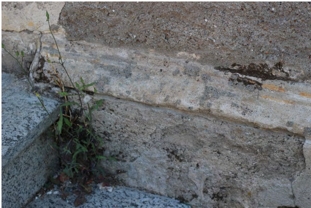
34z- Corpo principale