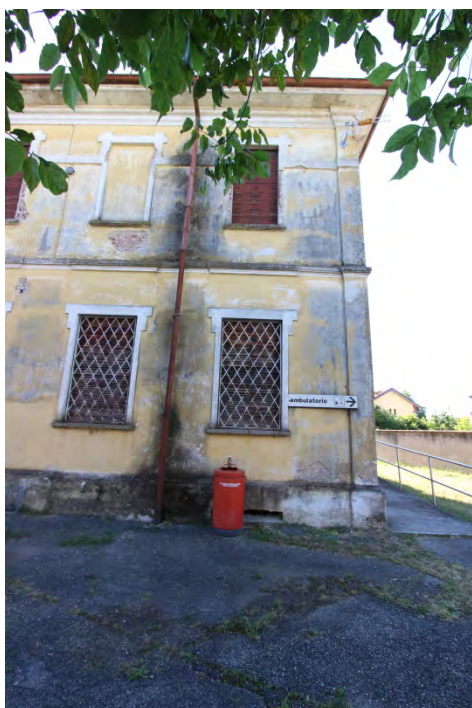
9- Facciata est