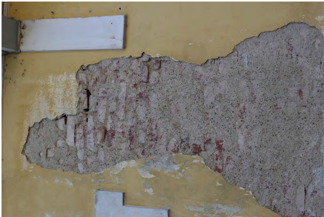
69i- Corpo principale – distacco di intonaco in prossimità del balcone con presenza di umidità