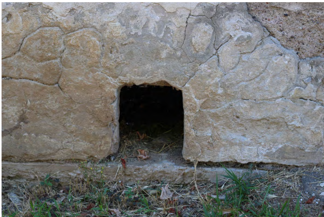
30z- Corpo principale