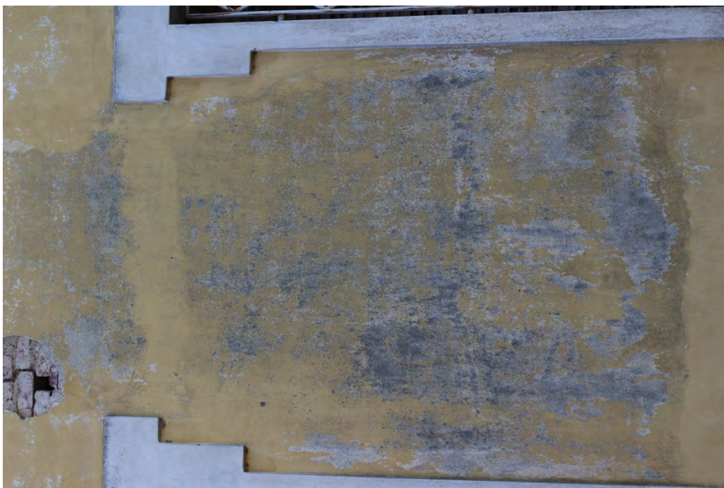
72i- Corpo principale – dilavamento dell'intonaco e presenza di umidità per condensa