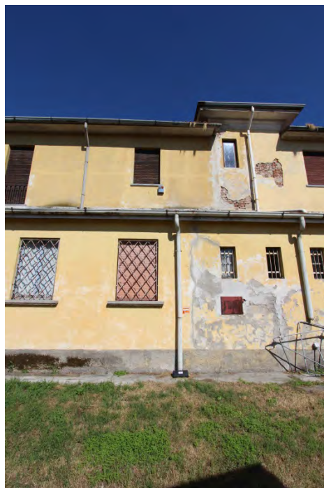
17- Facciata ovest