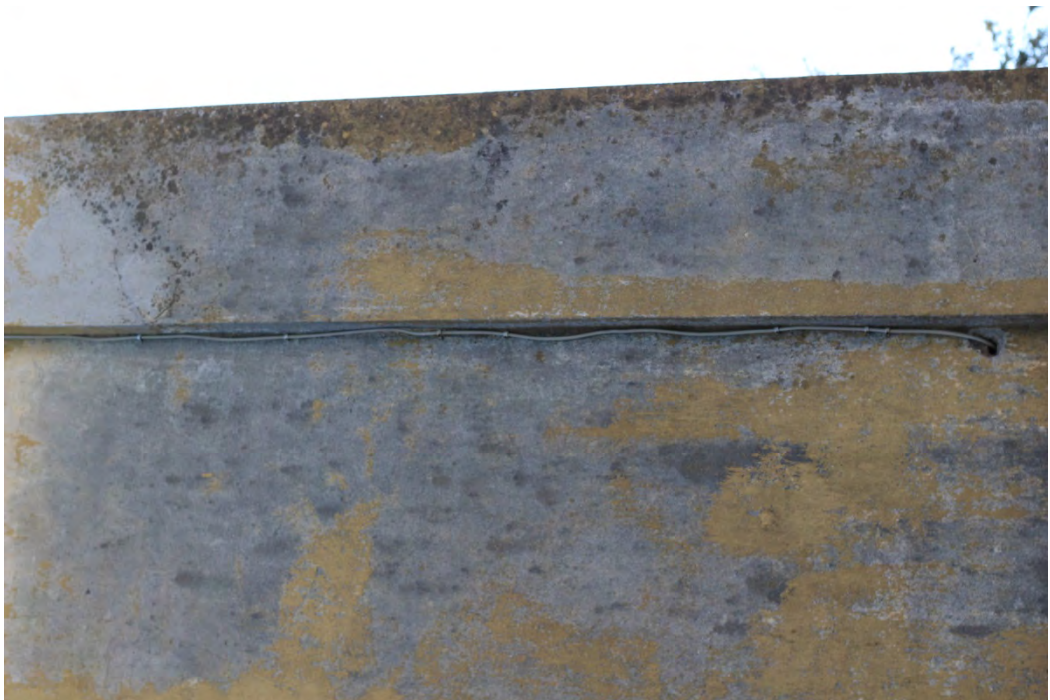
74i- Corpo principale – dilavamento dell'intonaco e presenza di umidità per condensa