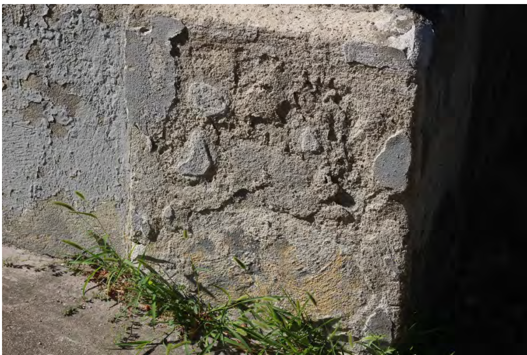
49z- Corpo principale