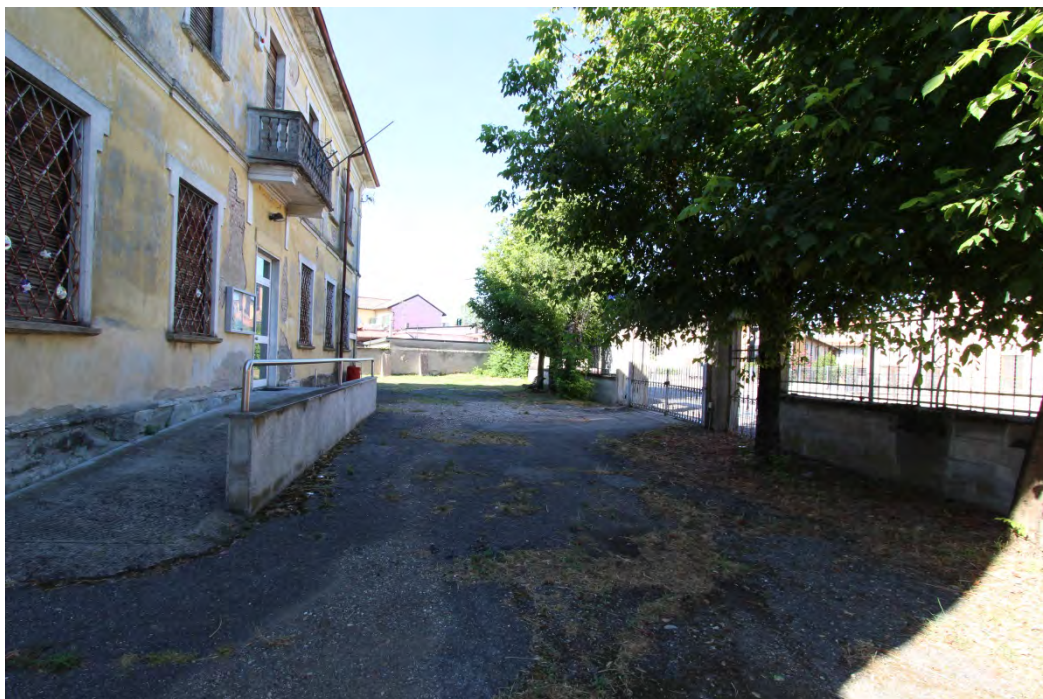
24- Area ingresso principale