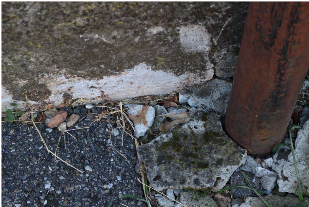
50z- Corpo principale