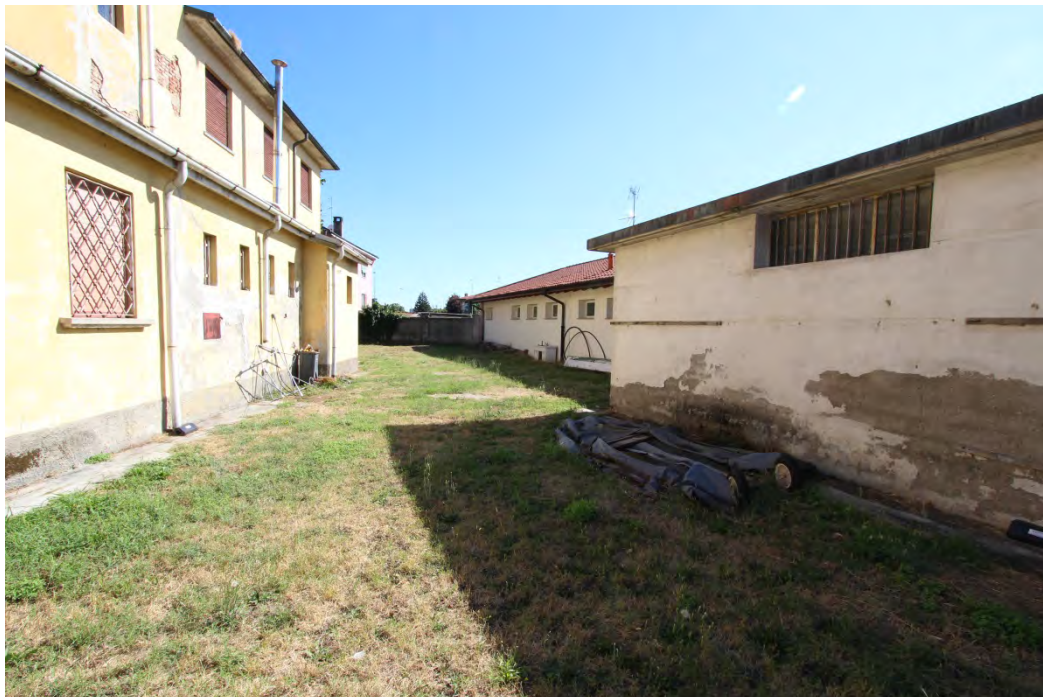
26- Area lato posteriore con edificio gestione pozzo servizio idrico