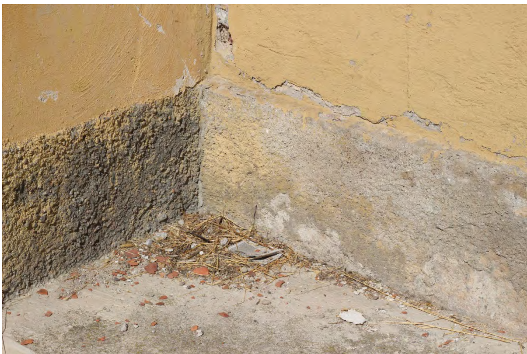
45z- Corpo secondario