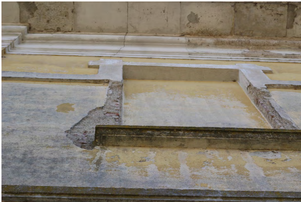
53c- Corpo principale – cornici finestre

Il rivestimento esterno –cornici finestre e davanzali