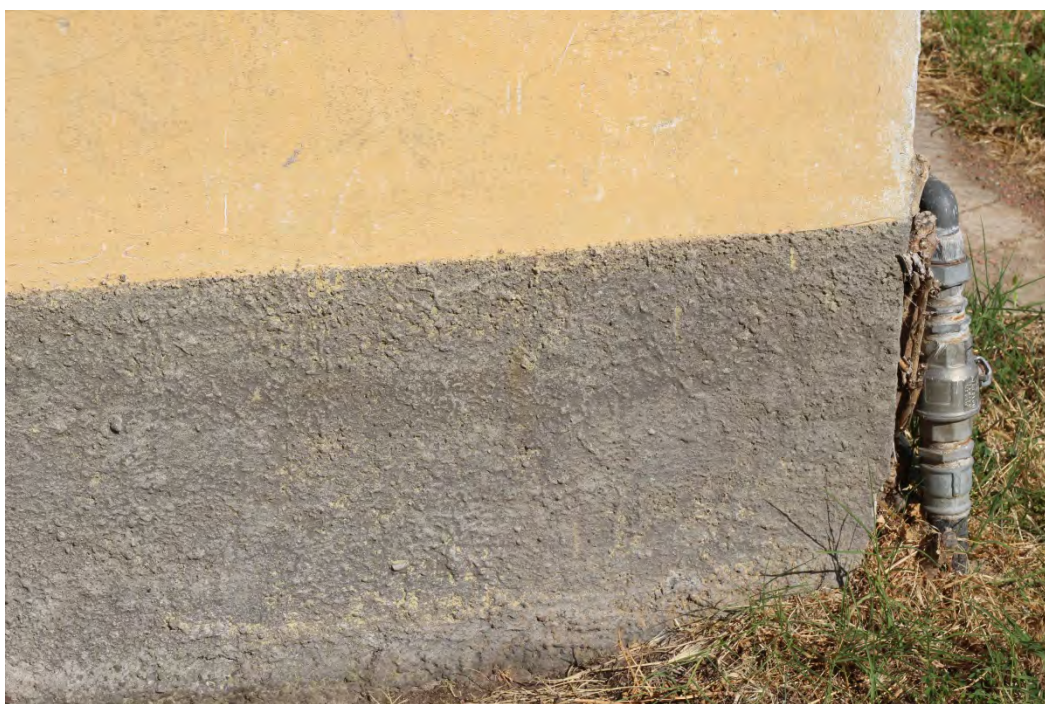
43z- Corpo secondario