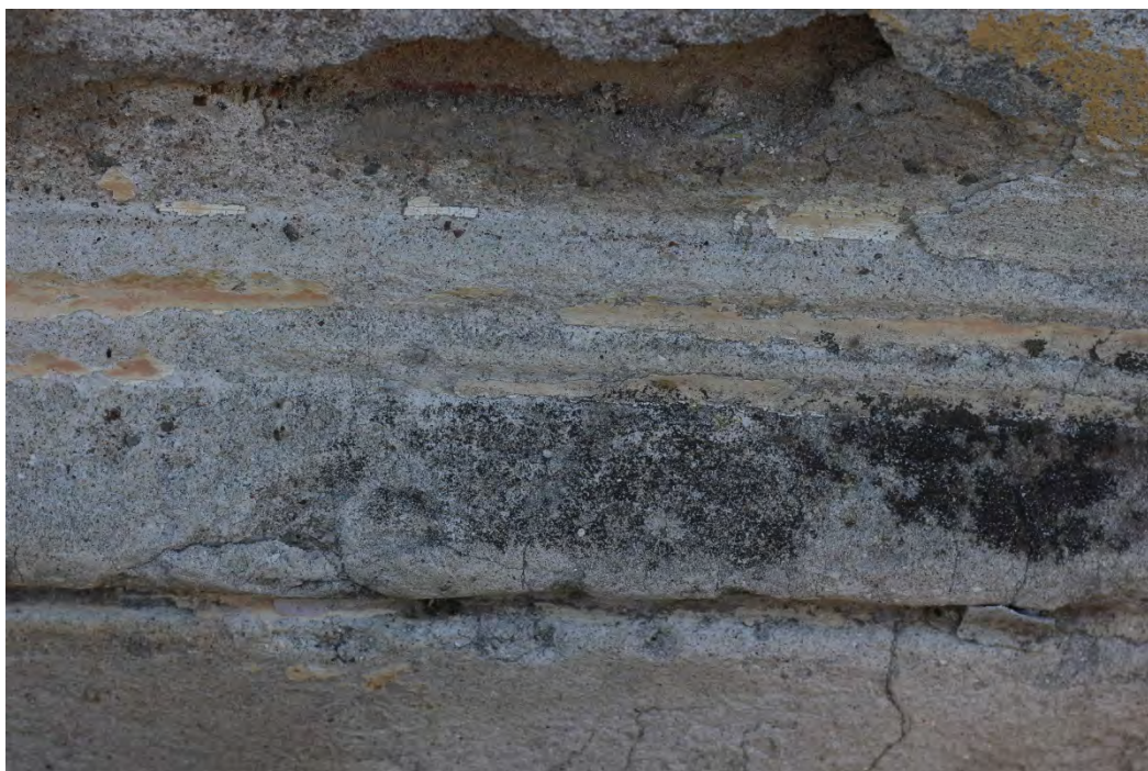
33z- Corpo principale