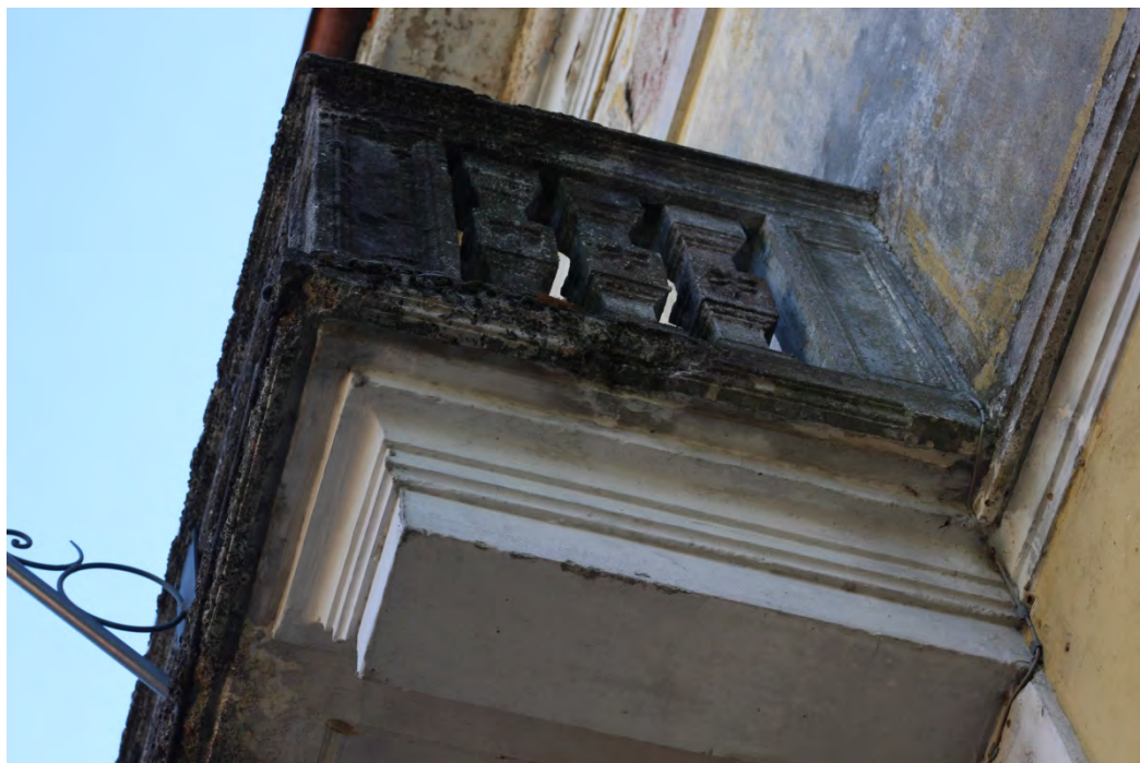
61b- Balcone – sagomatura mensola e bordo inferiore

Il rivestimento esterno – davanzali e balcone