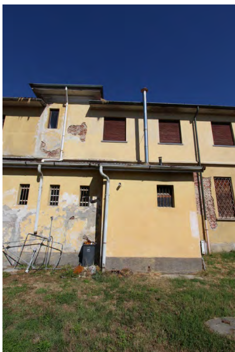
20- Facciata ovest