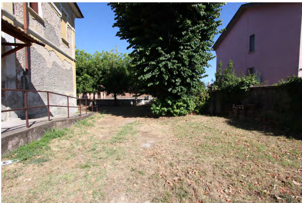
27- Area fianco sud dell'edificio