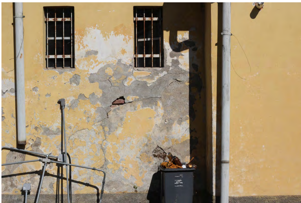
80i- Corpo secondario – presenza di umidità di risalita e parziale distacco dell'intonaco