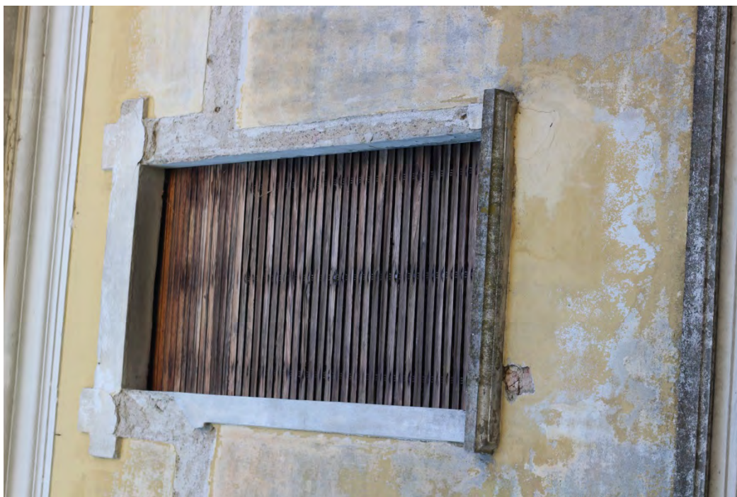
68i- Corpo principale – intonaco in presenza di umidità nella muratura