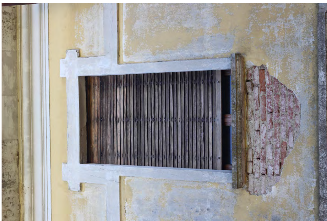
58c- Corpo principale – sagoma cornici finestre al primo piano