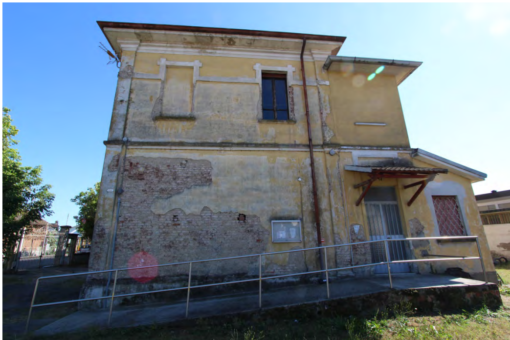
10- Facciata nord