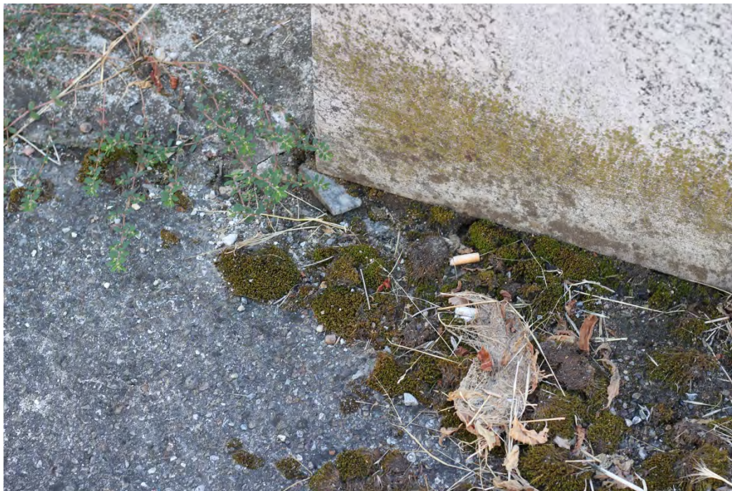
52z- Corpo principale