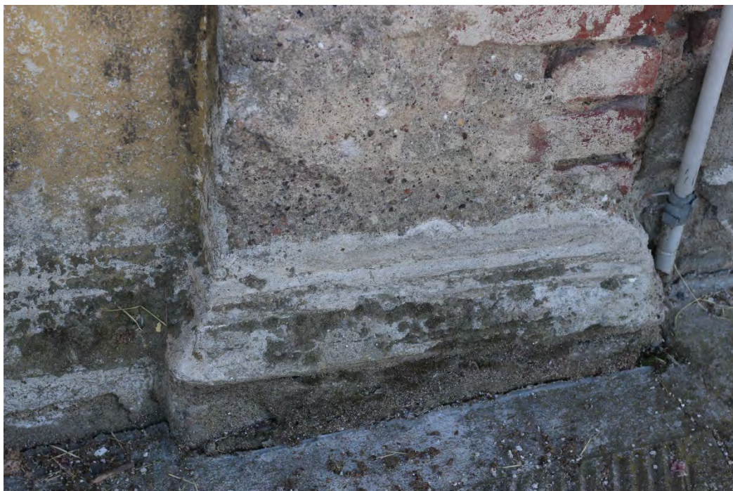
40z- Corpo principale