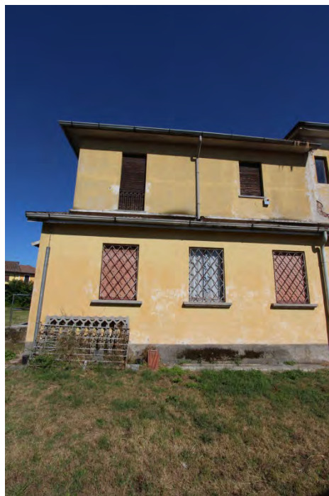
15- Facciata ovest