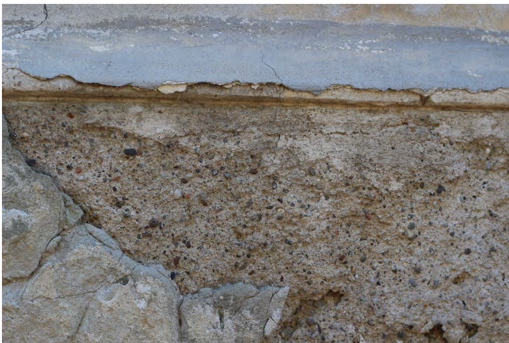
51z- Corpo principale