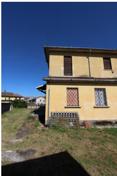
14- Facciata ovest