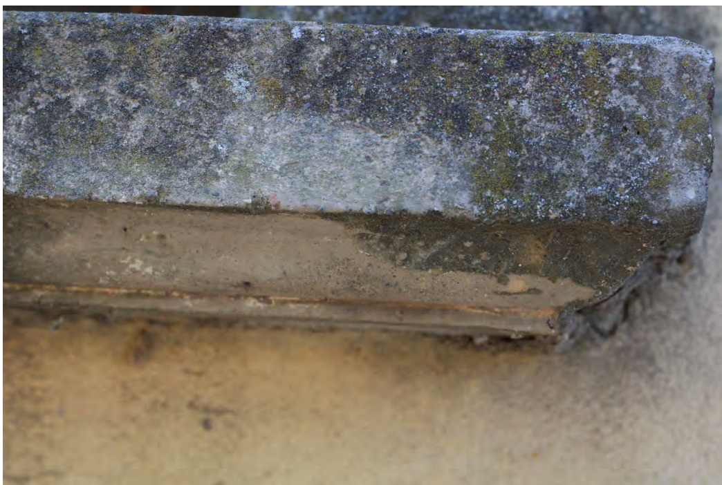
60c- Davanzale con sagoma finestre corpo principale