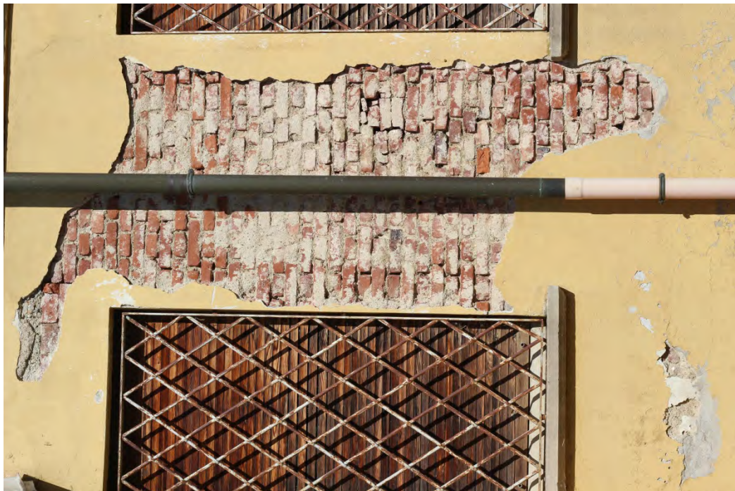
83i- Corpo secondario – distacco intonaco e lesioni partenti dalla gronda