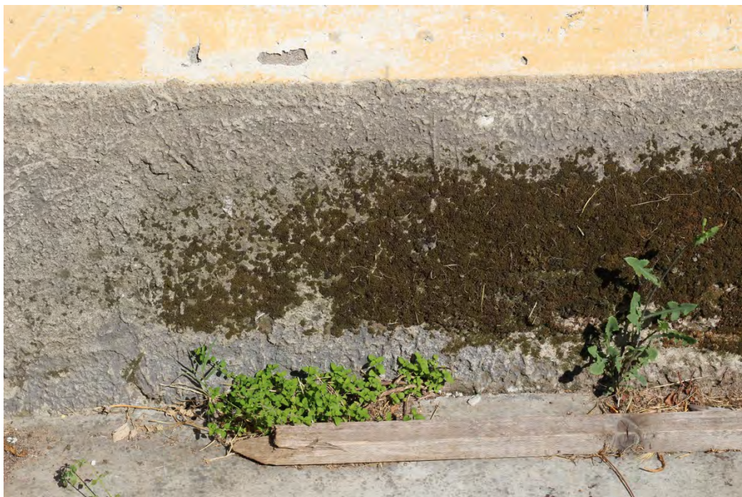
42z- Corpo secondario