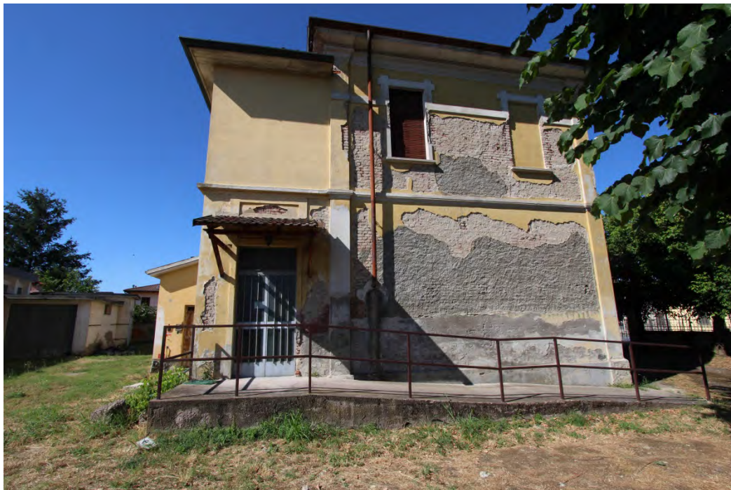
22- Facciata sud