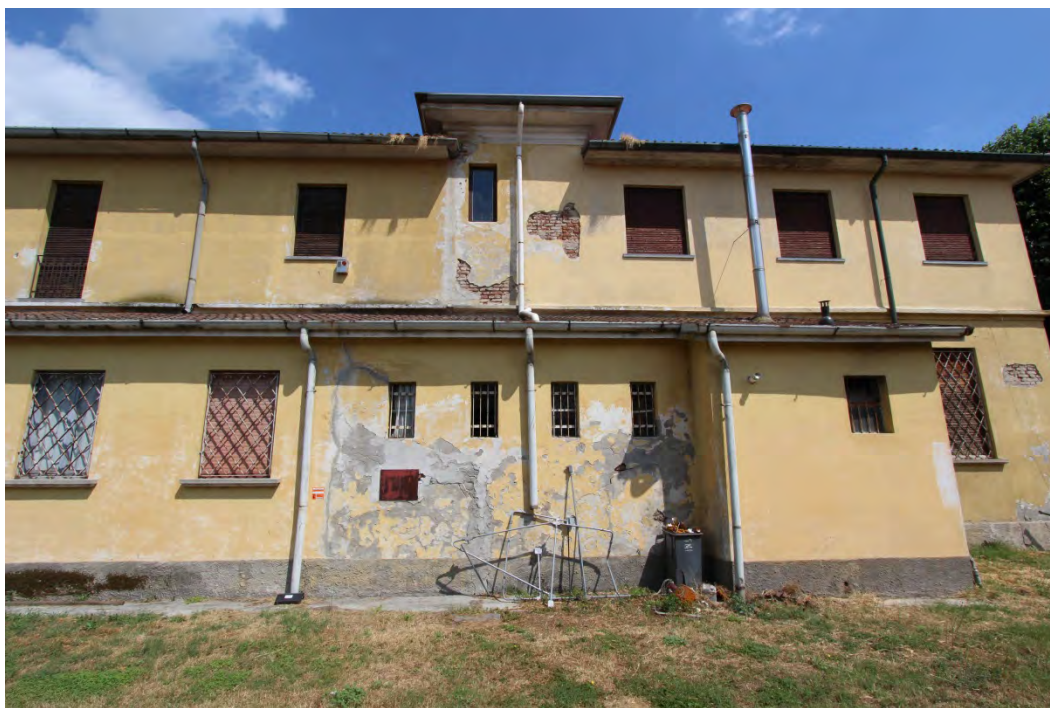
12- Facciata ovest