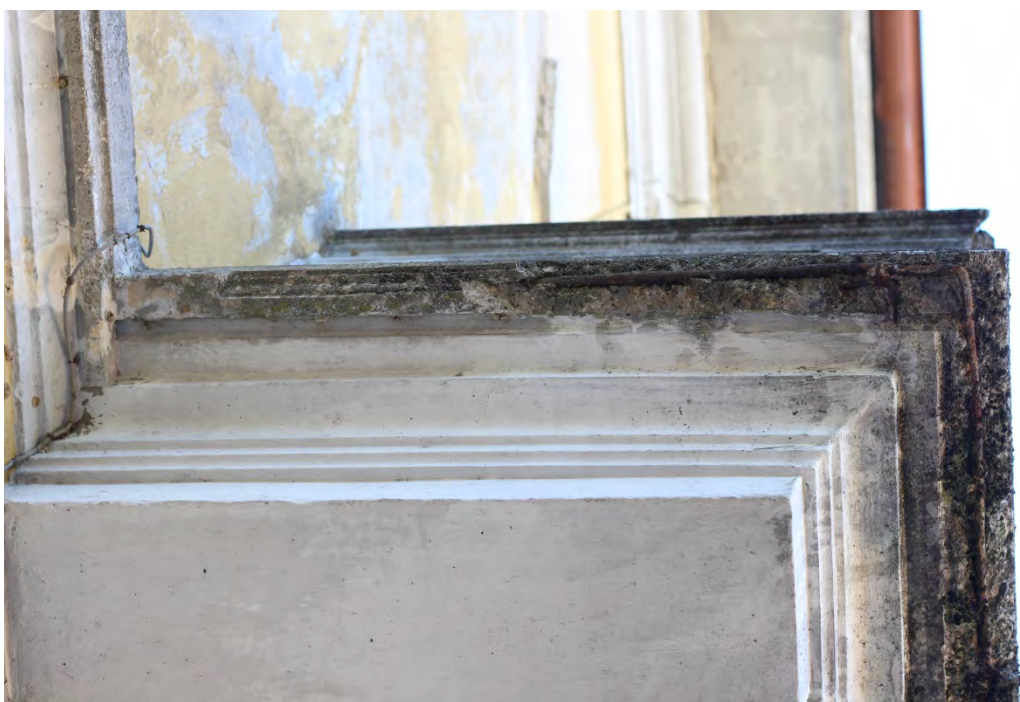
64b- Balcone – dettaglio bordo inferiore con armatura in ferro esposta