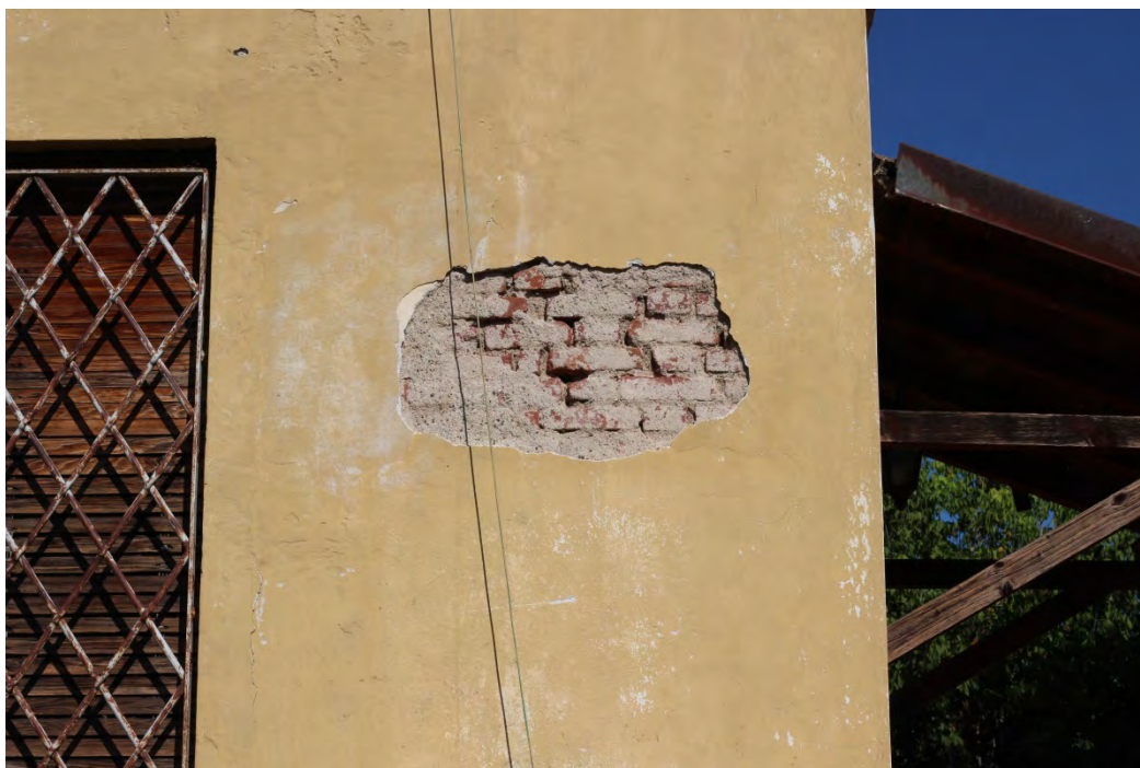
84i- Corpo secondario – presenza di umidità da condensa e distacco dell'intonaco