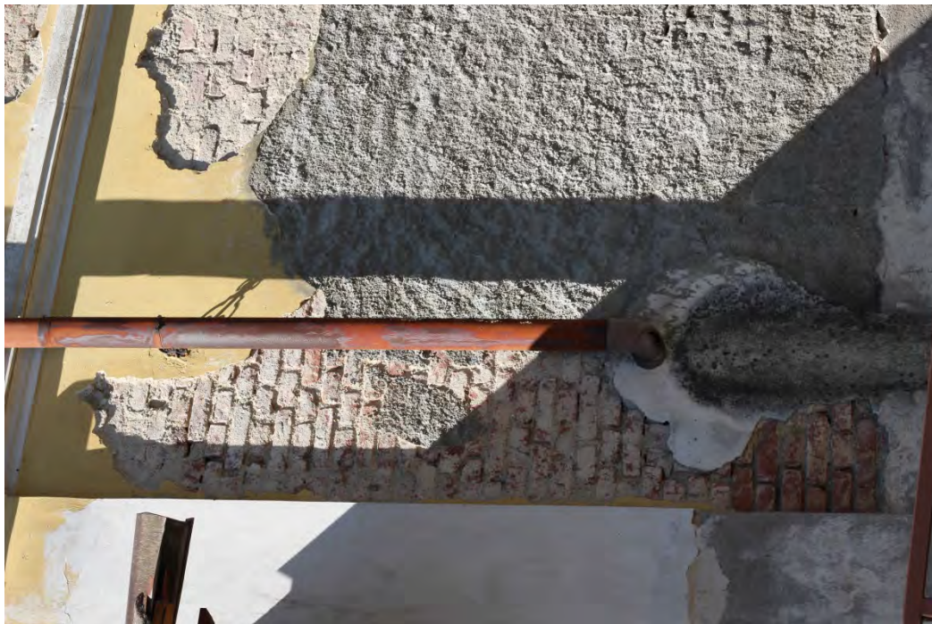
85i- Corpo principale – ripresa dell'intonaco con malta cementizia