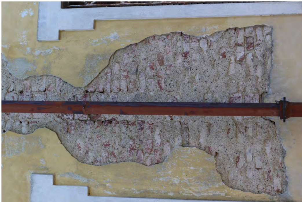
65i- Corpo principale – muratura senza intonaco in corrispondenza del pluviale