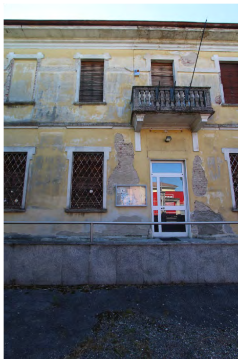
06- Facciata est