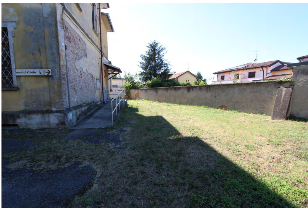
25- Area fianco nord dell'edificio