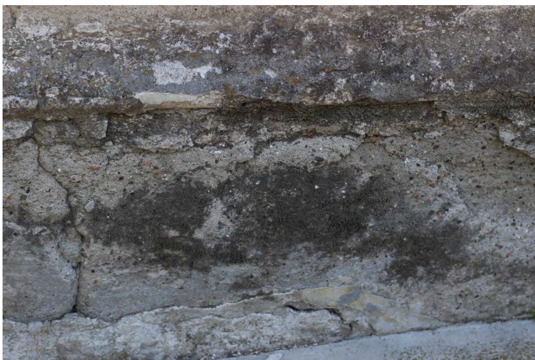
31z- Corpo principale