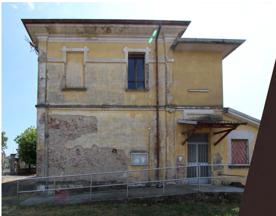
11- Facciata nord – parziale raddrizzamento