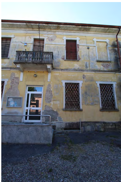
7- Facciata est