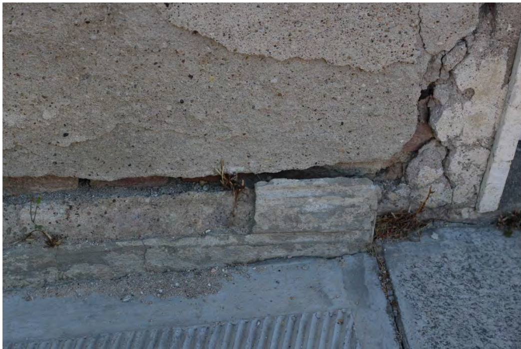
32z- Corpo principale