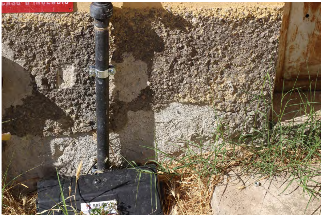
44z- Corpo secondario