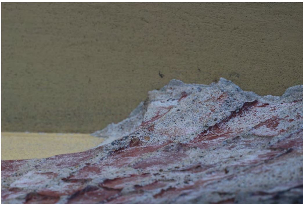
56c- Corpo principale – dettaglio spessore intonaco cornici finestre