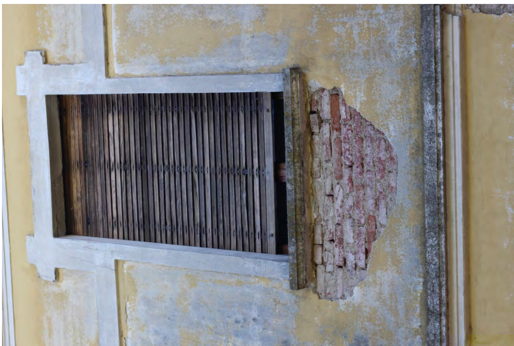
66i- Corpo principale – muratura senza intonaco nel sotto davanzale