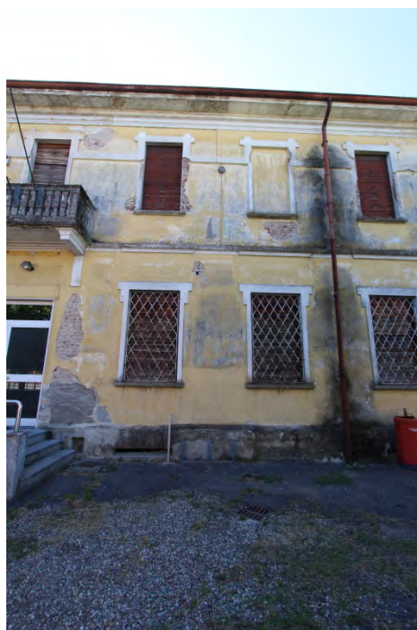
8- Facciata est