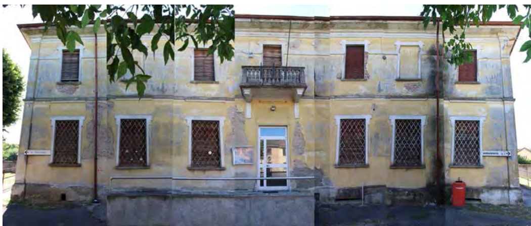
2- Facciata est – assemblaggio delle immagini di dettaglio successive