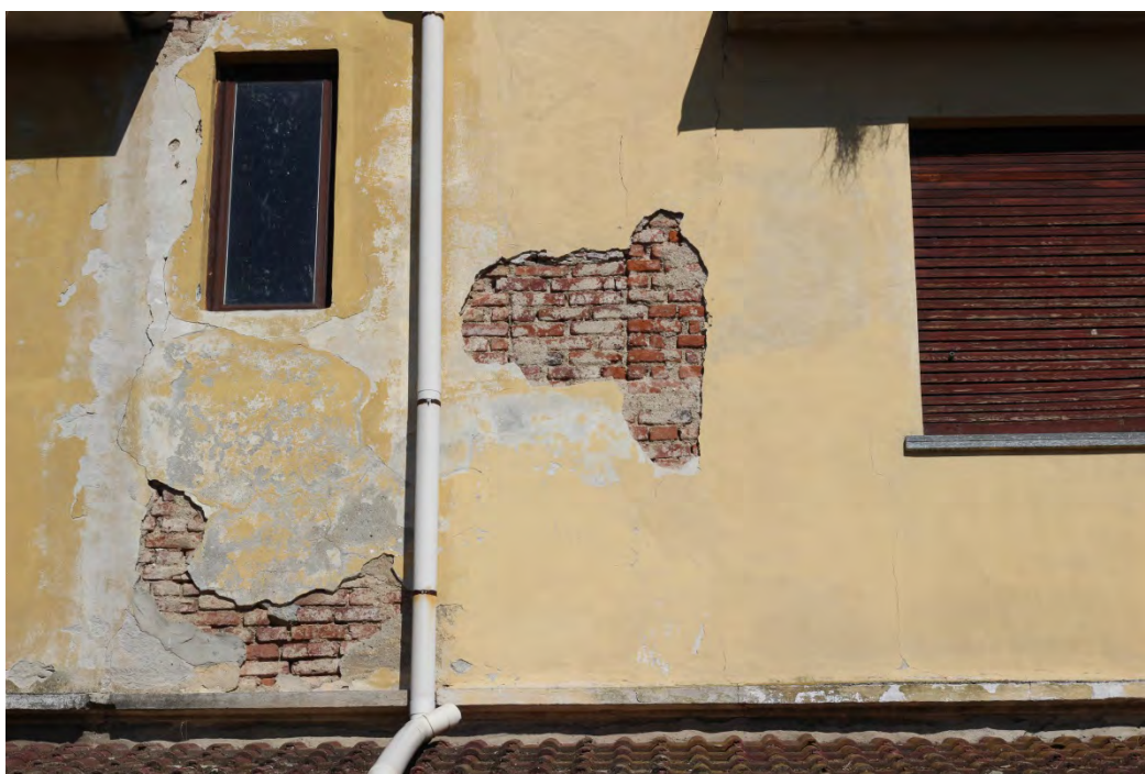
82i- Corpo secondario – distacco intonaco e presenza di infiltrazioni dalle gronde