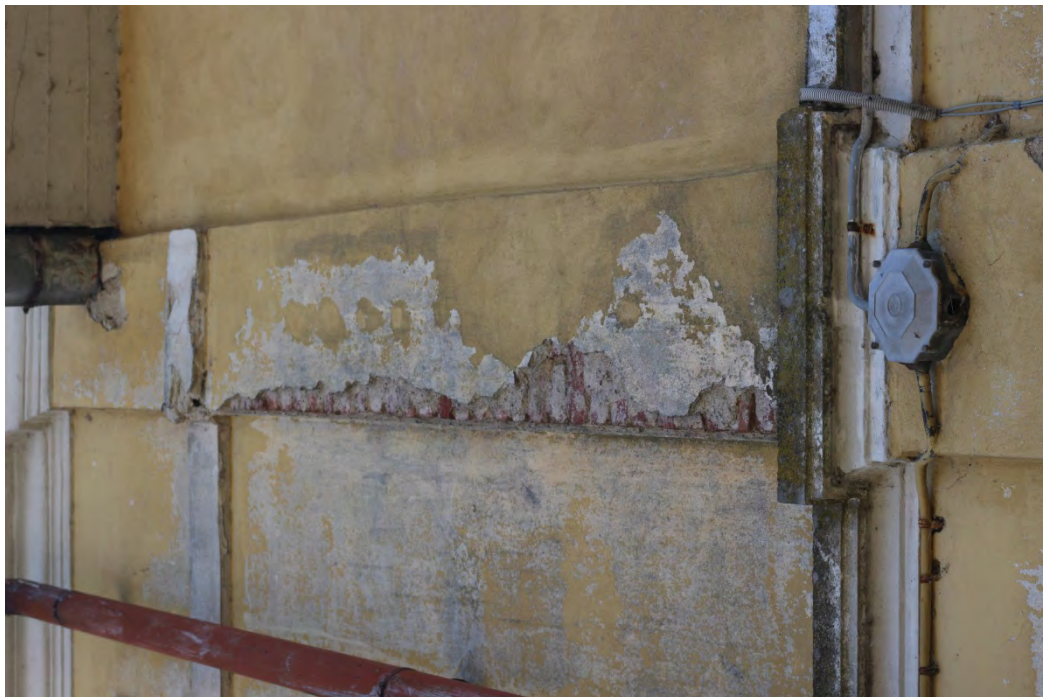
77i- Corpo principale – distacco di intonaco dalla lesena pilastro e presenza umidità