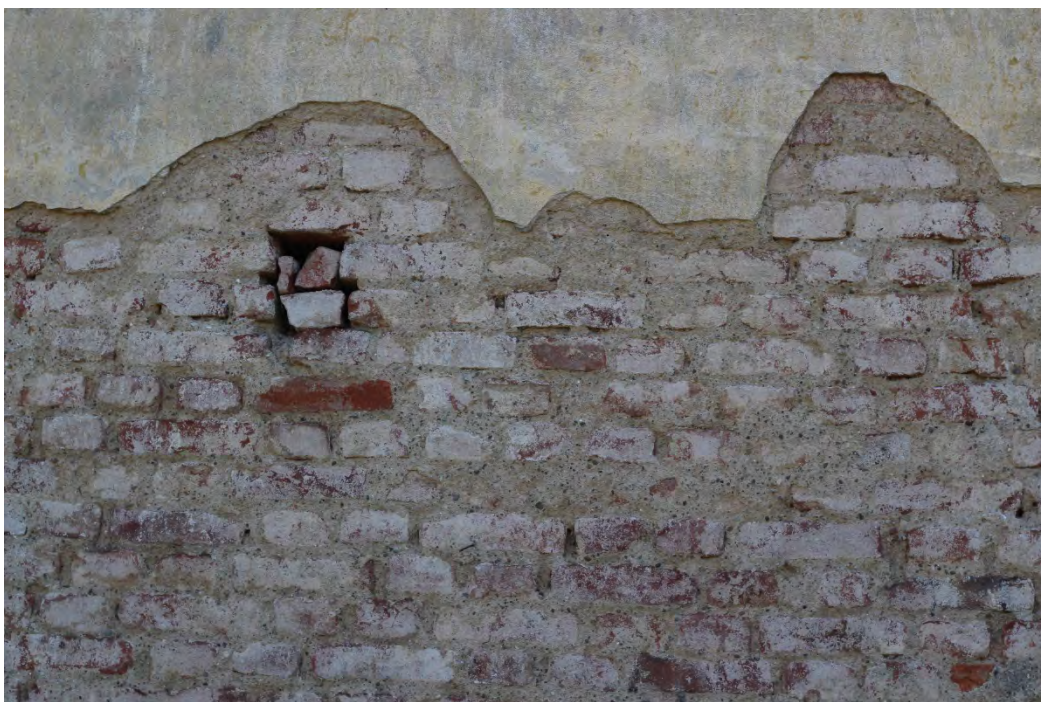
76i- Corpo principale – porzione di muratura con lesioni in assenza di intonaco