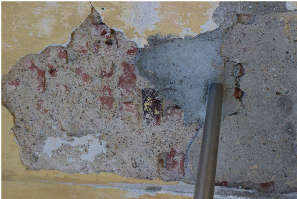
79i- Corpo principale – distacco intonaco originale e ripresa in corrispondenza del parapetto della rampa