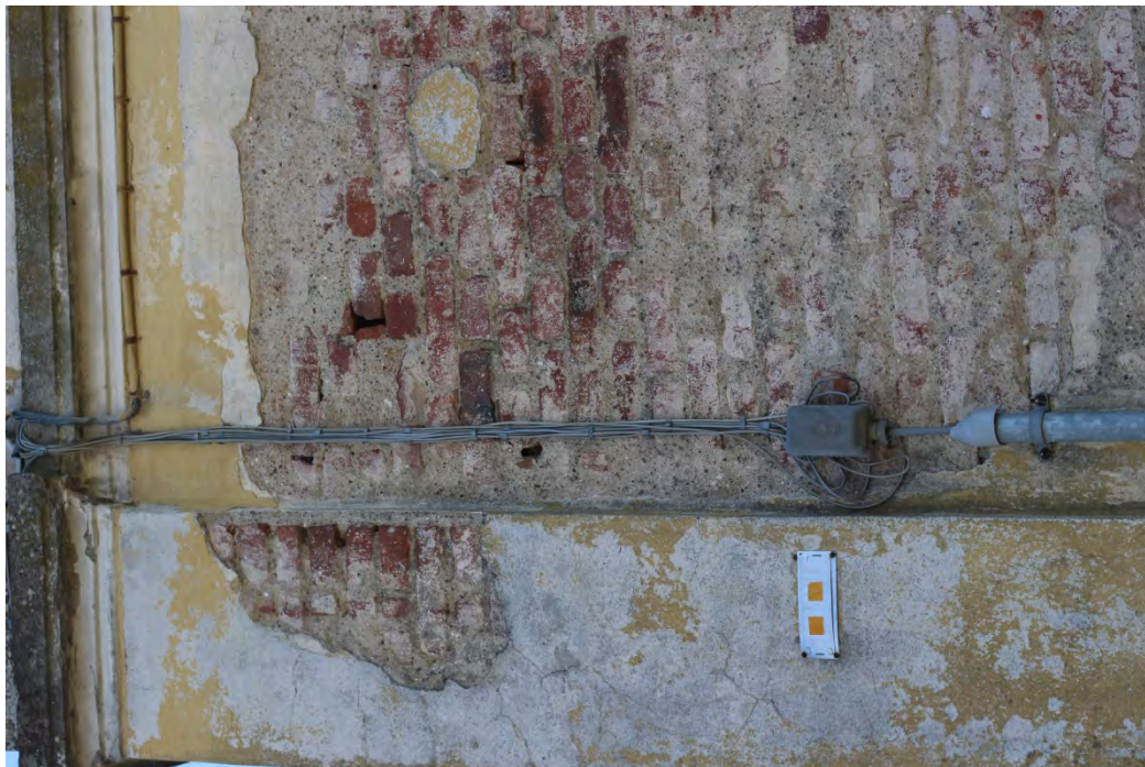
75i- Corpo principale – porzione di muratura con lesioni in assenza di intonaco