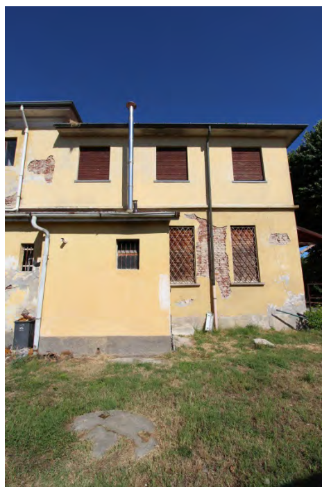
21- Facciata ovest