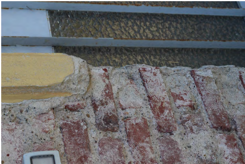
55c- Corpo principale – cornice porta accesso laterale