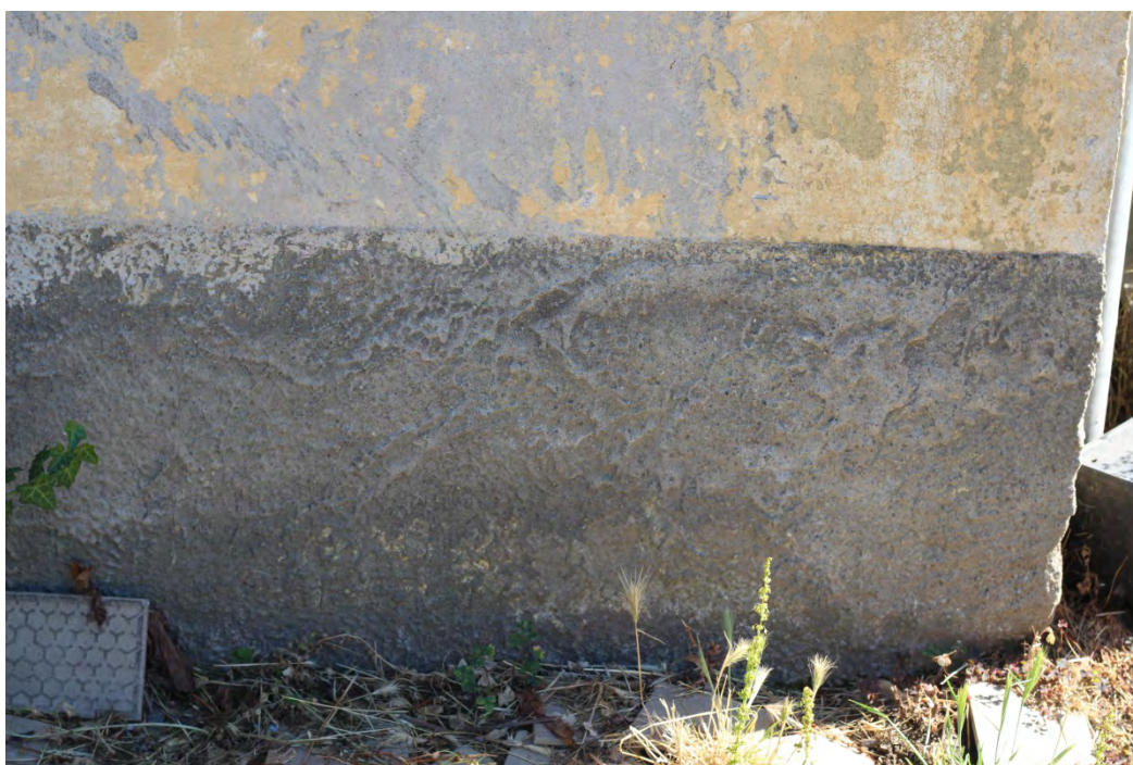
41z- Corpo secondario