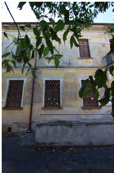
04- Facciata est