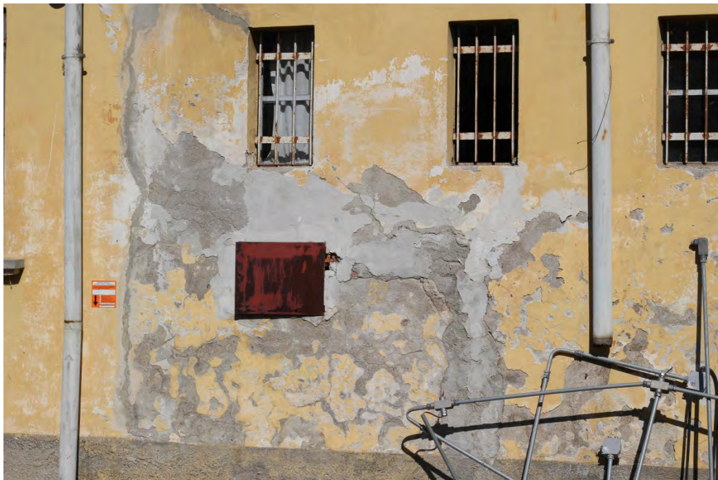
81i- Corpo secondario – presenza di umidità di risalita e parziale distacco dell'intonaco