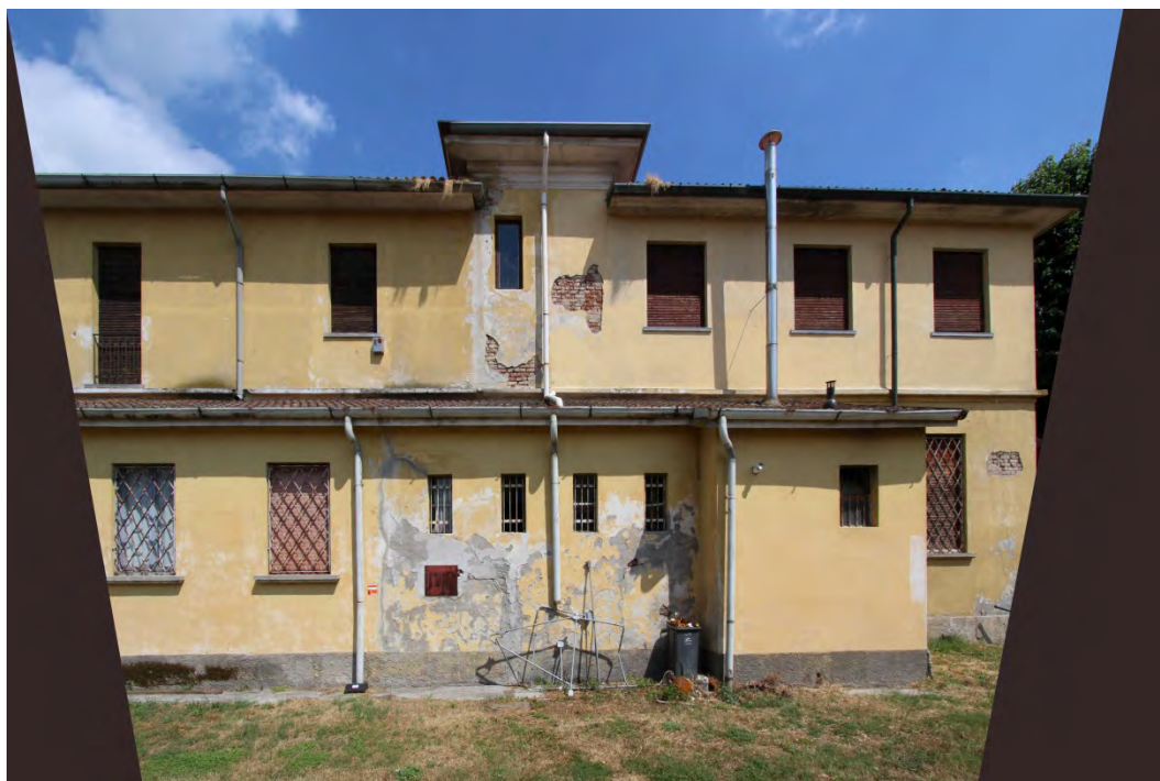
13- Facciata ovest – parziale raddrizzamento