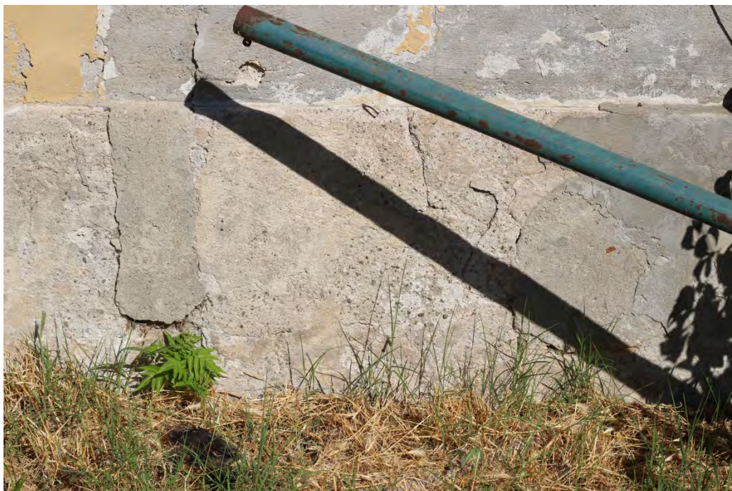
46z- Corpo secondario