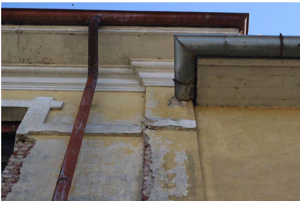
78i- Corpo principale e secondario – infiltrazione da canale di gronda e dilavamento facciata