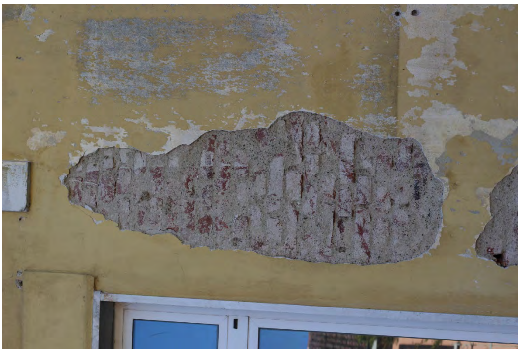
70i- Corpo principale – distacco di intonaco in prossimità del balcone con presenza di umidità