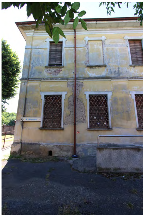
03- Facciata est