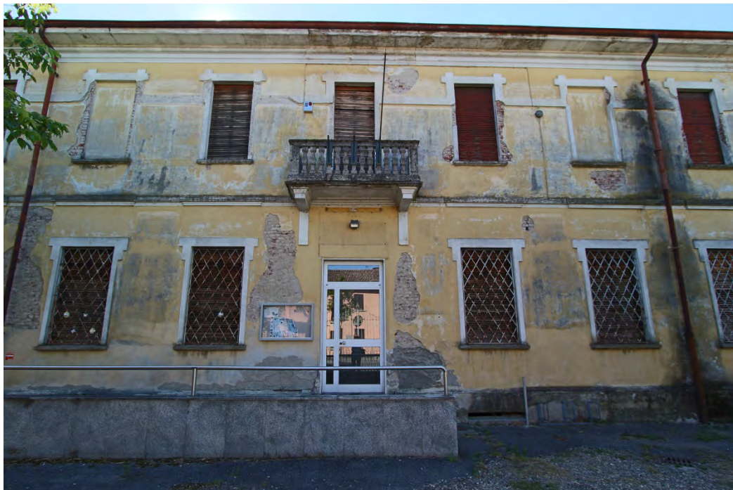
1- Facciata est