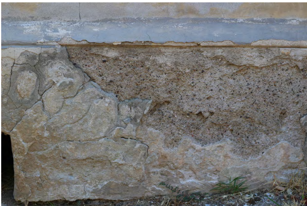
29z- Corpo principale

* Immagini riprese in senso antiorario partendo dallo spigolo sud-est