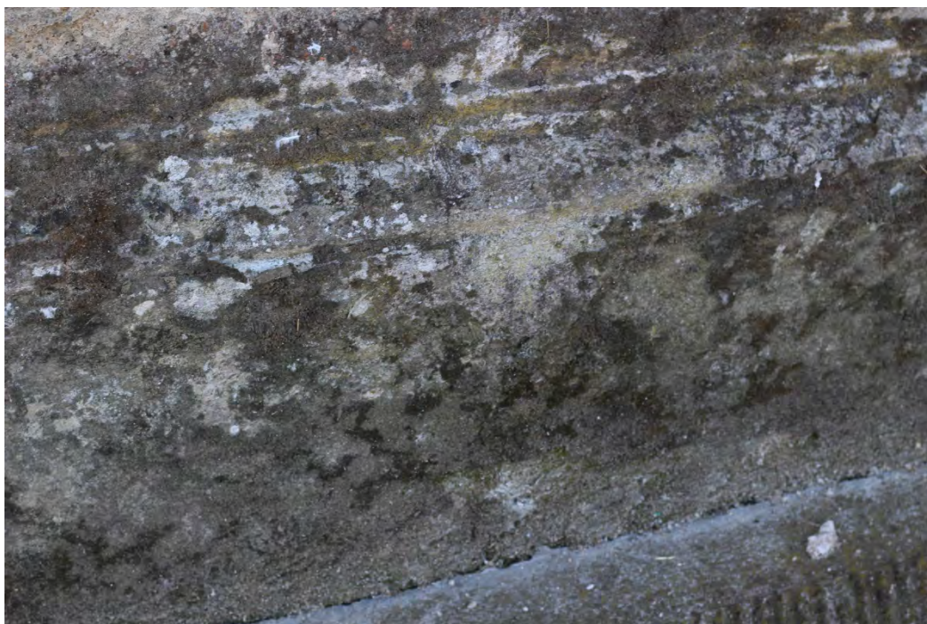
39z- Corpo principale