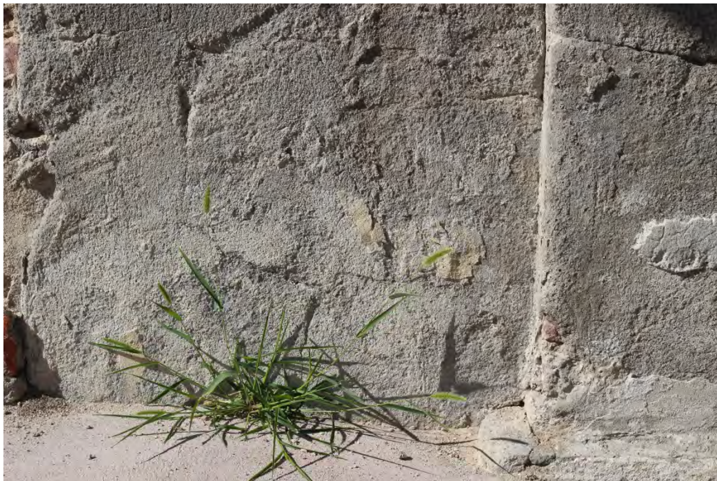
48z- Corpo principale