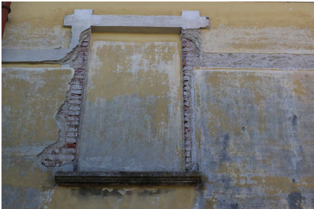
67i- Corpo principale – cornici senza intonaco e dilavamento per presenza umidità