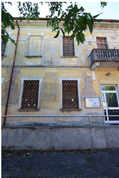
05- Facciata est