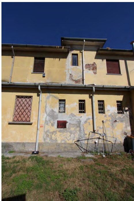
18- Facciata ovest