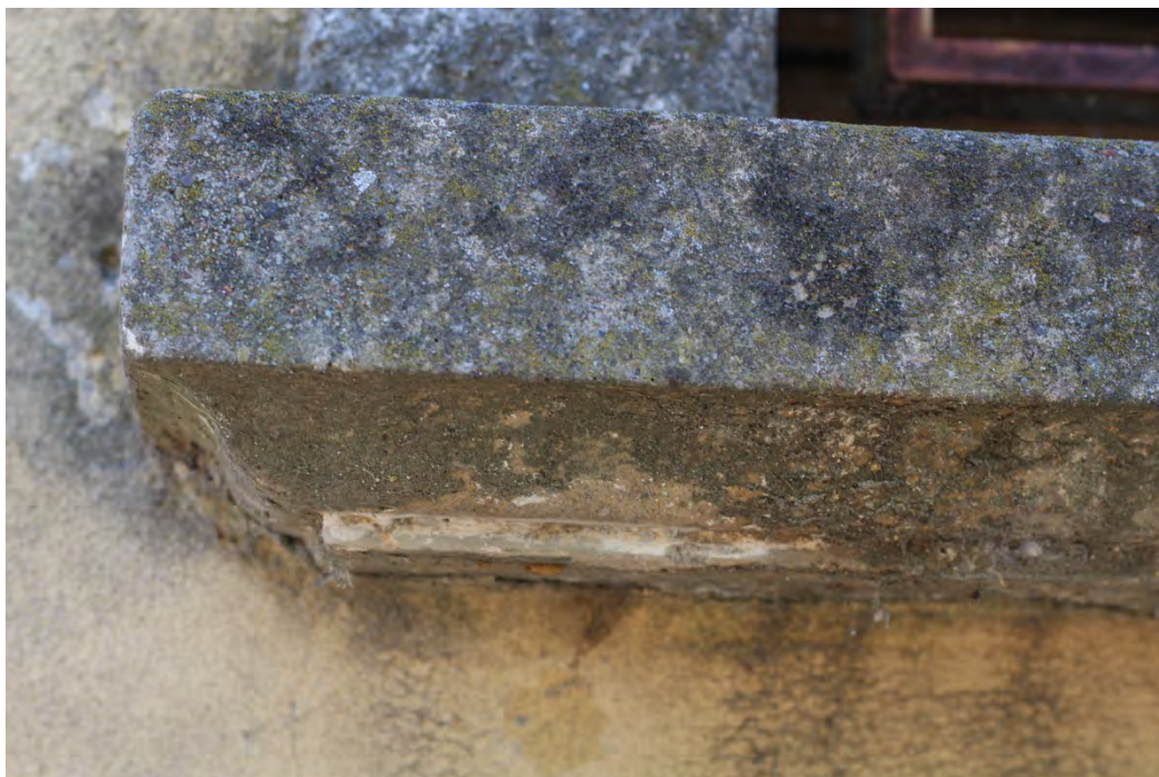
59c- Davanzale con sagoma finestre corpo principale