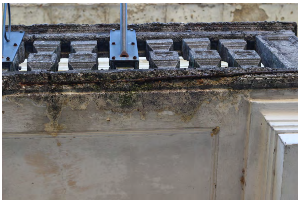
62b- Balcone – parapetto e bordo inferiore