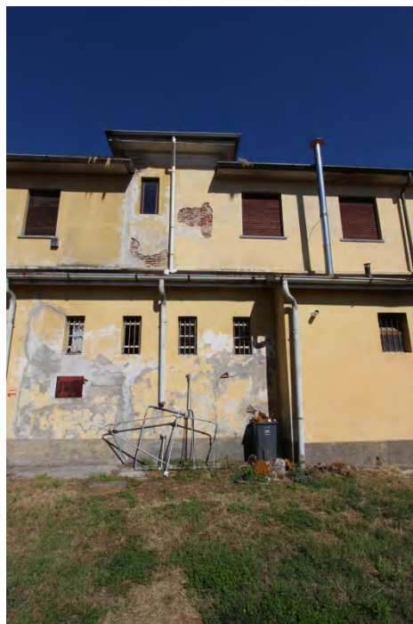
19- Facciata ovest