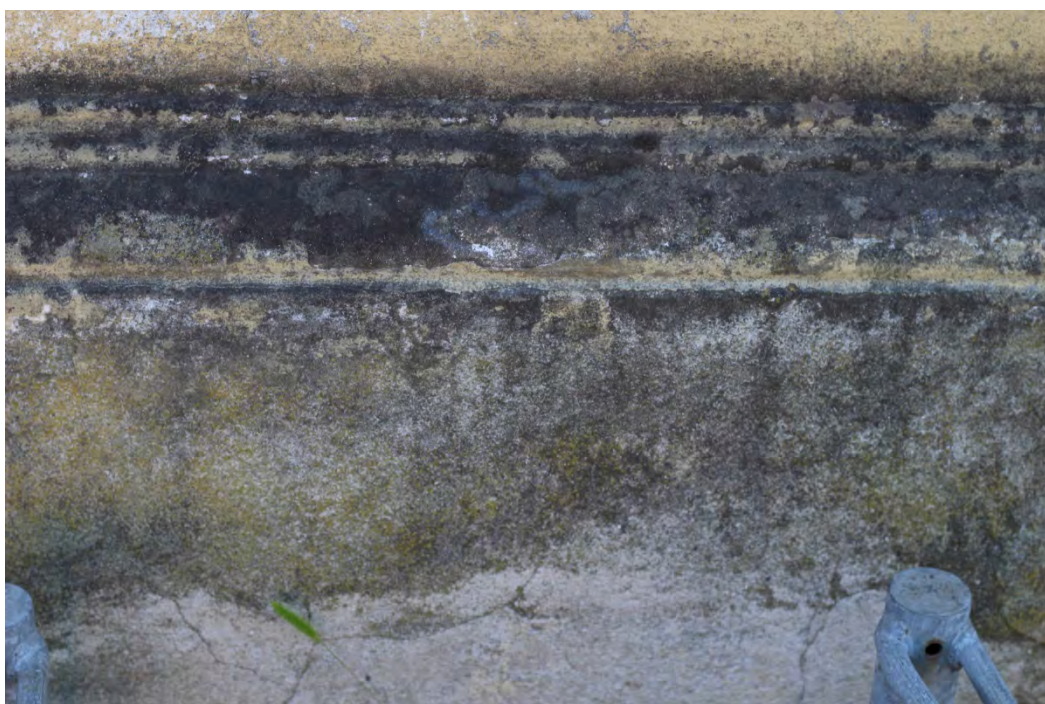
35z- Corpo principale